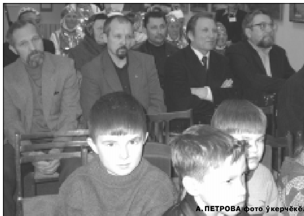
* Презентацие хуҗана кансем.