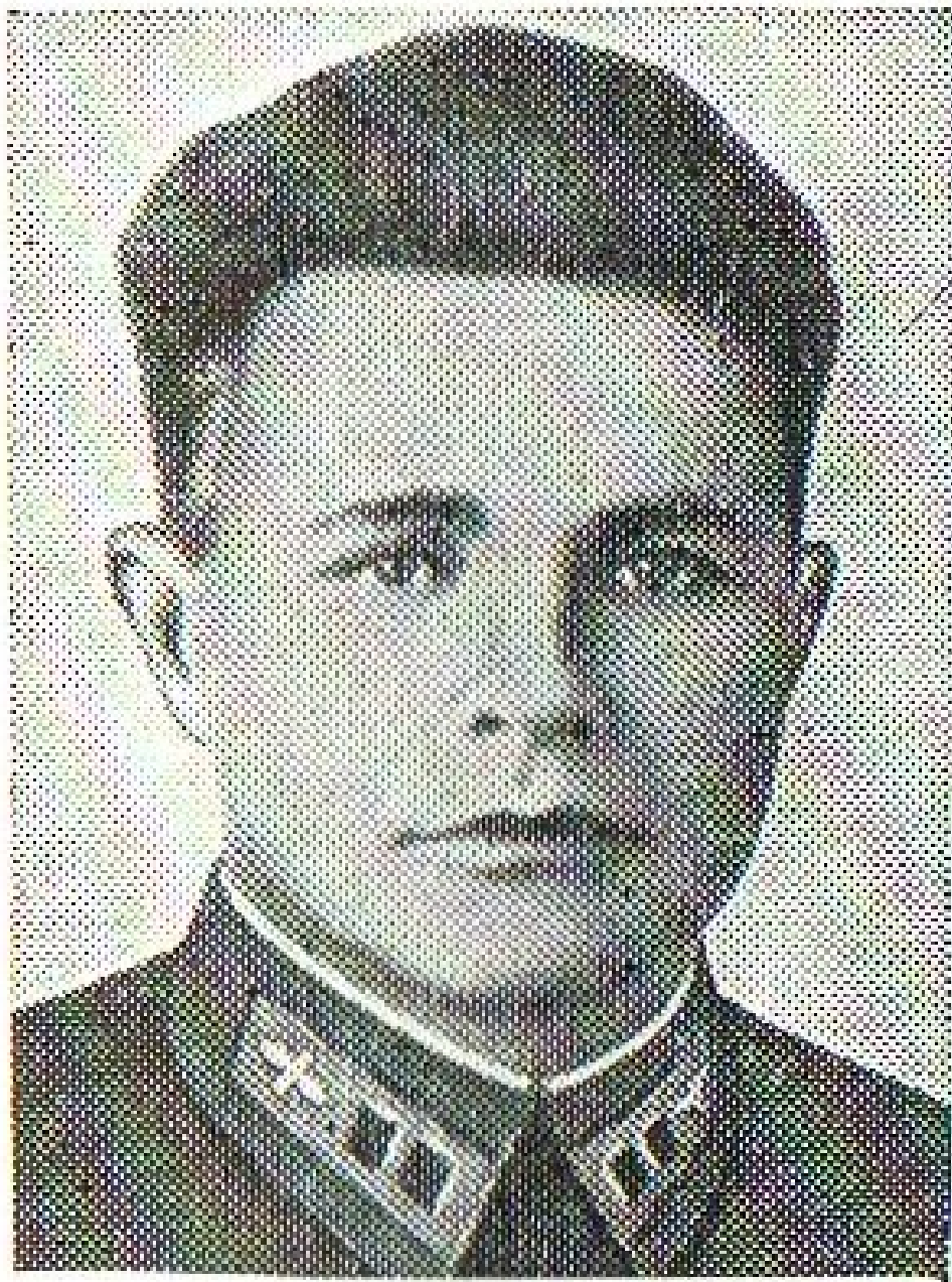
И. И. Фёдоров