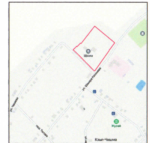
— Проектируемый объект