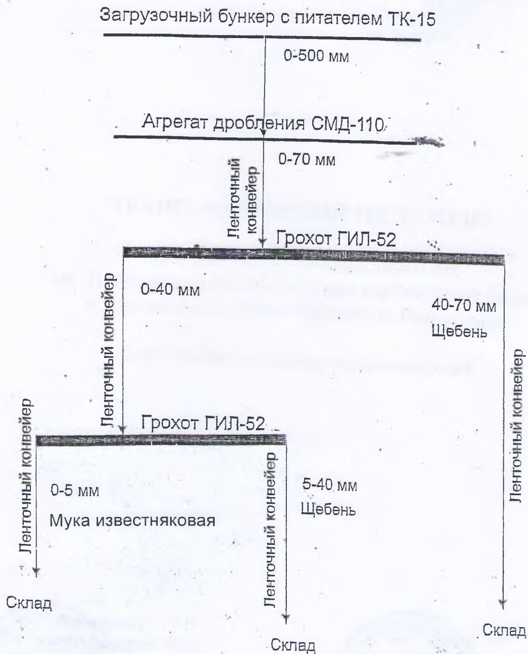
Рис. № 3.

Технологическая схема работы дробильно-сортировочной установки (см. рис. 3).