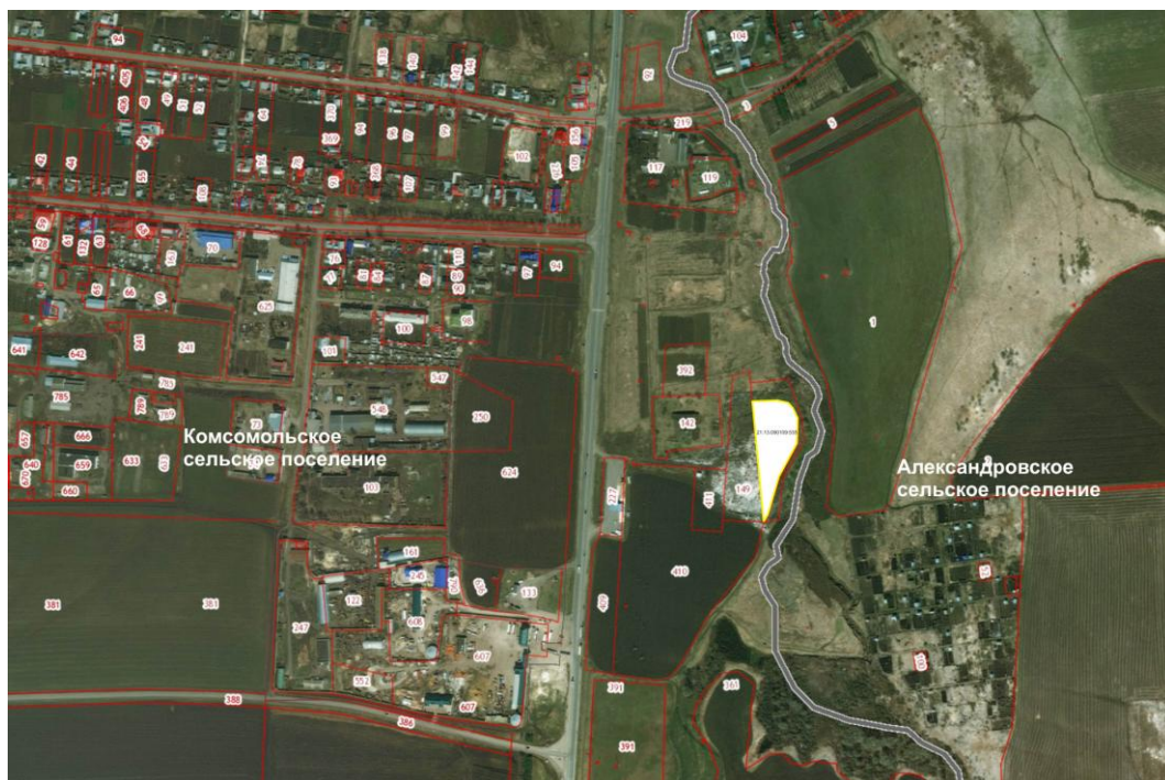
Рис. 3. Схема расположения земельного участка с кадастровым номером 21:13:090109:535

Данный земельный участок расположен на границе Комсомольского сельского поселения восточнее села Комсомольское рядом с участком с кадастровым номером 21:13:090109:149, который используется для размещения свалки отходов (рис.3).