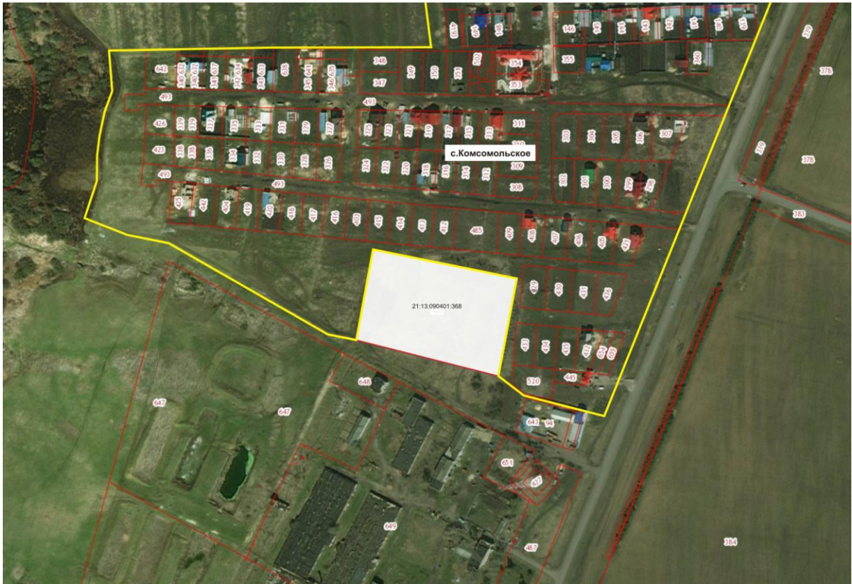
Рис. 1. Схема расположения земельного участка с кадастровым номером 21:13:090401:368

Кадастровые сведения о данном земельном участке приводятся в таблице № 2.