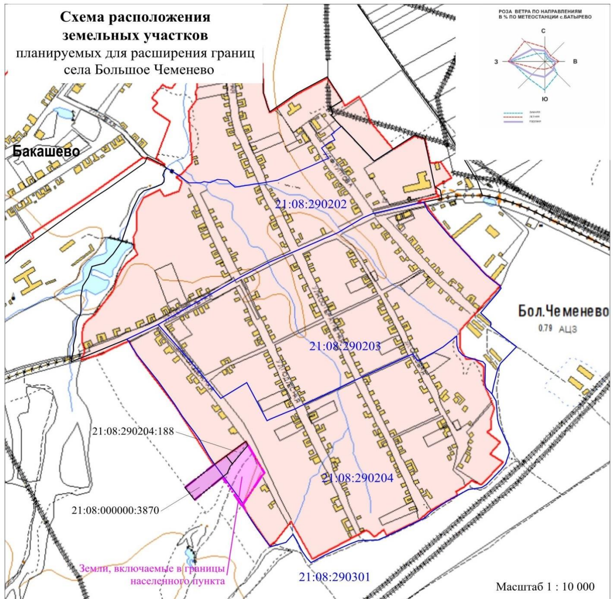
Рис. 2. Схема расположения земельных участков

В соответствии с частью 5.1 статьи 23 Градостроительного кодекса Российской Федерации, в состав Проекта включены каталог координат (перечень характерных точек границ) и план границ объекта (план планируемой границы села Большое Чеченево) в системе координат, используемой для ведения Единого государственного реестра недвижимости – МСК-21 зона 1 – Приложение № 3 и Приложение № 4.