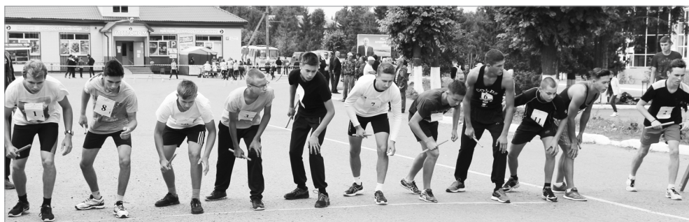
Стартра – аслэ сұлхи яшсем.