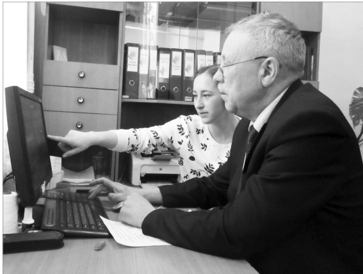
Апла пулсан вәхәта та, уқса-тенке те перекетлемелле – порталта регистрациленсе сәмәлләхпа усә курмалла.

Сәпла вара патшаләх услугисем порталё урлә водитель удостворенине илнэ е уләштарна чухне, автомобиле регистрациленё чухне, ют сёршыва кайма ирөк паракан паспорт тунә чухне, сөмье сәвәрнине регистрациленё е мәшәр уйрәлнә чухне пәхса хунә патшаләх пошленине тўлеме ансат.