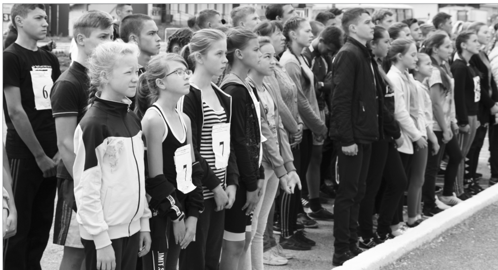
Яланхи пекех, амăртăва шукулсен командисем йышлэ хутшăнчэ.