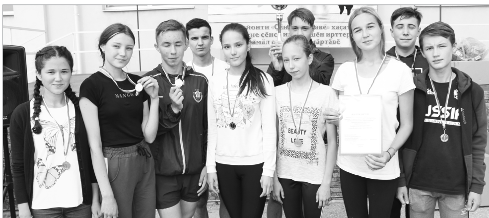
Сатракасси шукулэн команди – кубок хуши.

Кёрхи кунсем, кунпа пёрлех сёнэ вёрену сүлэ пусланнэ май, районти «Сэнтэру ялавэ» хаçатан парнисемпе куçса сүрекен кубокэсене сёнсе илессишэн сэмал атлетсен эстафета амăртăвене ирттересси районти йалана кёнэ ёнтэ. Савна май чылайашешэн ку вэл – кётнэ амăрту. Шукул ачисем, предприятисемпе организацисен, ял тарахэсен тата сэмье командисем амăртăва хаваспах хутшанащэ. Мёншэн тесен спорта чаннипех юратакансемшэн кирек епле спорт амăртăвэ те вэл яланах уяв – спорт уявэ.