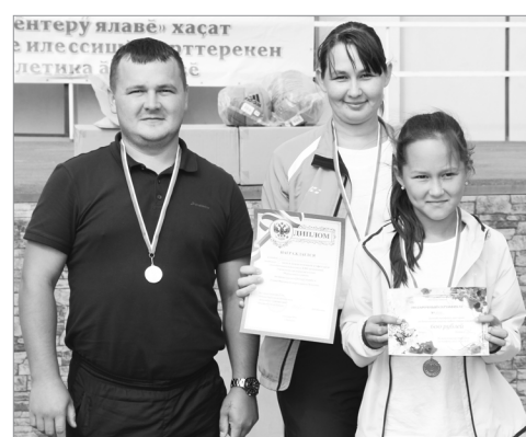
Григорьевсен сэмье команди амăртура 2-меш пулчэ.