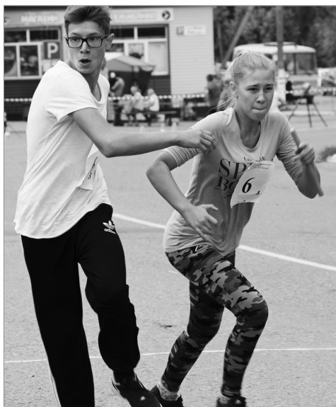
Дистанцисенче керешу сивеч пычэ.