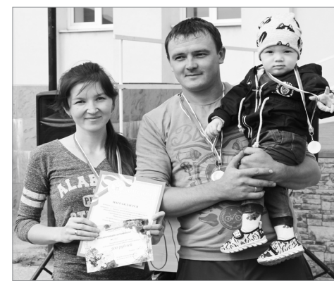
Сергеевсем амăртăва сұлталăк сурăри ачипе хутшăнчэ.