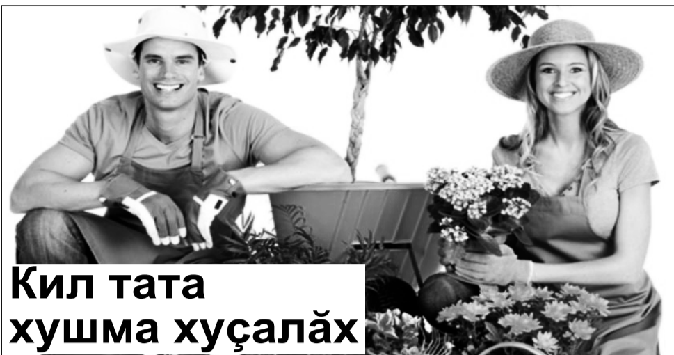
Кил тата хушма хушаләх

Хәтәр аджелика стерилизациленә банкасенә вәриллех тултәрмалла, виткәчпә хупмалла.