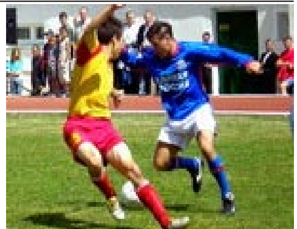
Команда «Единая Россия - звезды футбола» и «Чувашские медведи» 24.06.07 г.