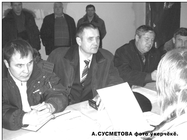
А. СУСМЕТОВА фото укөрчөкө.

Сурта паха саврансан генподрядчик «Конкорд Плюс» предприятия пусляхе Т.А.