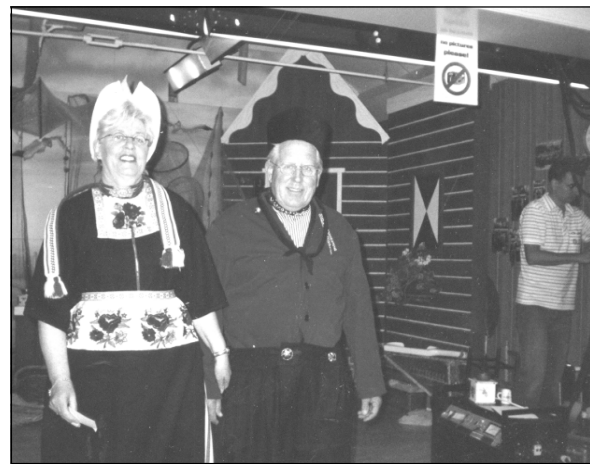
Голландецсем наци тумлҘе.

Аҗта кҗна илсе сҗреме пулҗ Ғаваш сҗрҘнчи учительсене. Амстердамра тҘлҘмелле вьрҗансем сахал мар. Акҗ XIX җмҘр вҘсҗнче туннҗ Шура тҘп вокзал. Вҗл 8687 йывҗҗ свҗй җинче тҗрат. Вокзалпа юнашар – Хҗмҗр кафе. Карапсемпе килекен-кайкан моряксем табак туртнннп җмҘрсем хушшинче тҘтҘмленсе ларннҗ зал туристсемшҗн интереслҘ.