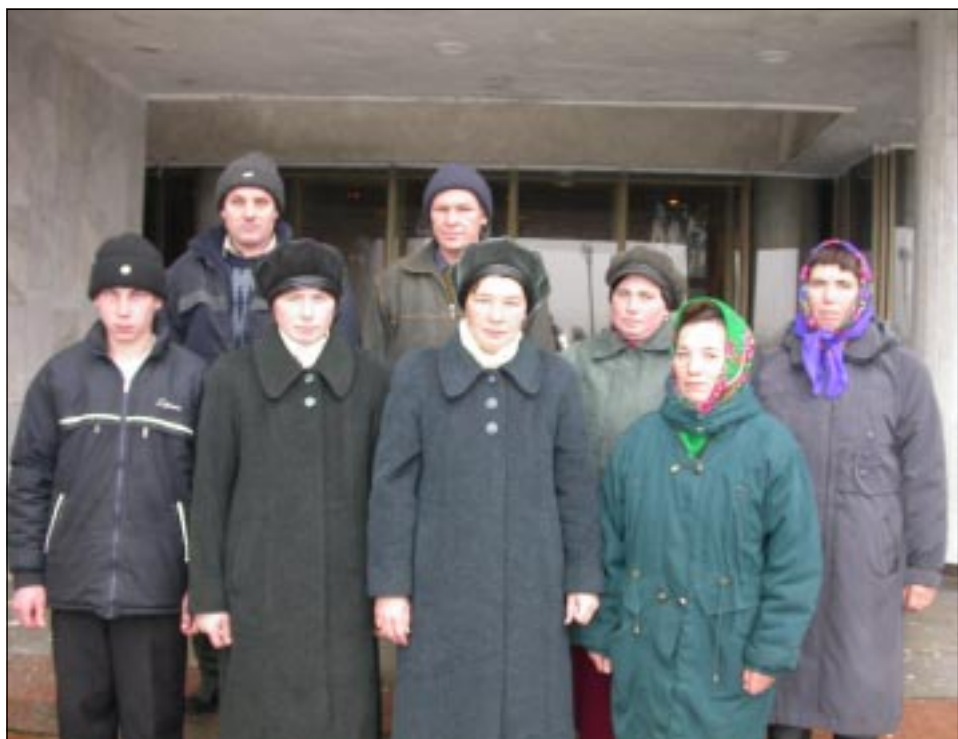
«ЧувашАгроМаркет» акционерсен хупá обществипе кáсал япáх мар тáрáшрё. районти уява пынá предприятти ёсченёсен пёр ушкáнё.