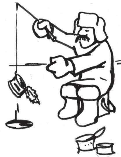
В. Семенов ӱкерӗкӑ.

Сегодня вышел двадцать третий номер приложения на русском языке