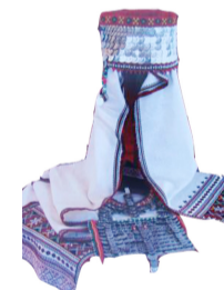
Сурпан – головной убор

Кӑштек – ластовица Сарӑ – поясное украшение Хултӑрмач – вышивка на рукаве Масмак – налобная повязка Тевет – перевязь через плечо Ама – нагрудное украшение