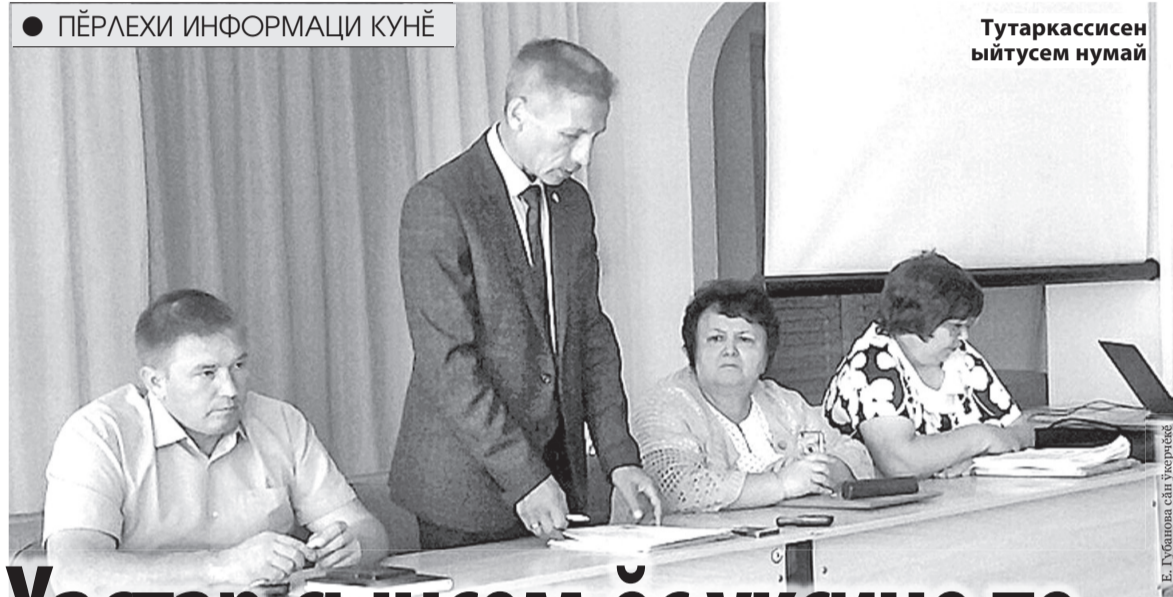
Тутаркассинен ыйтусем нумай