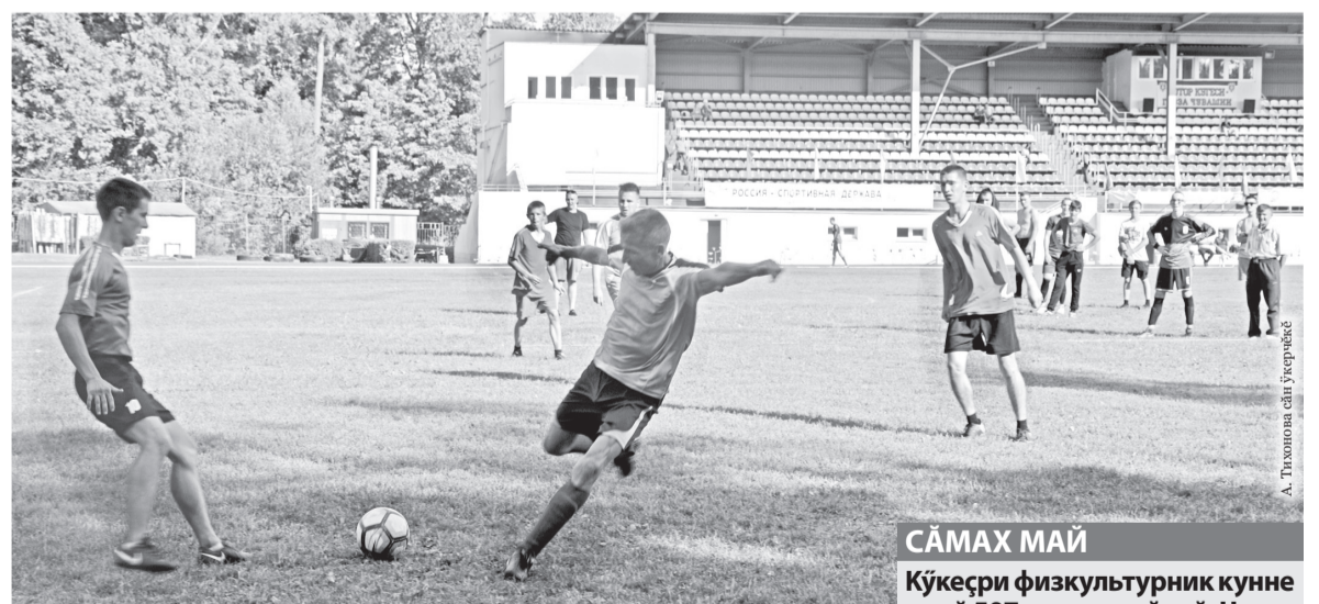
А. Тихонова сәлти үкөрчөк

Канат туртассинчө чөрө такана выляса илессисөн арсынсем шәл сүртса көрөшрөс. Хөрү те сивөч тупәшура Кәшавәш ял тәрах команди пуринчөн вәйлине сирөплөтрө.