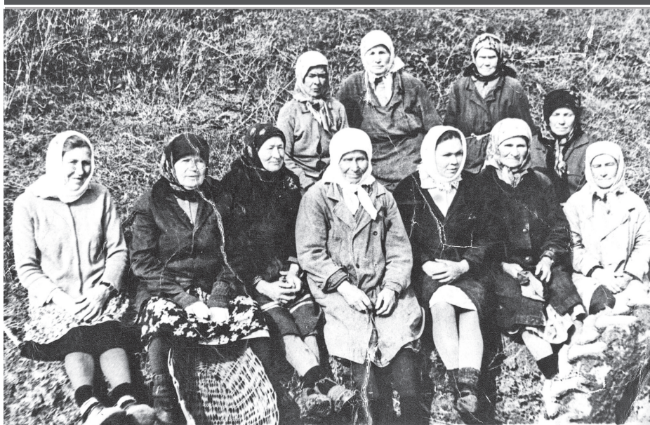
Ленин ячĕллĕ колхоз ĕсченĕсем, 1957 сұл.