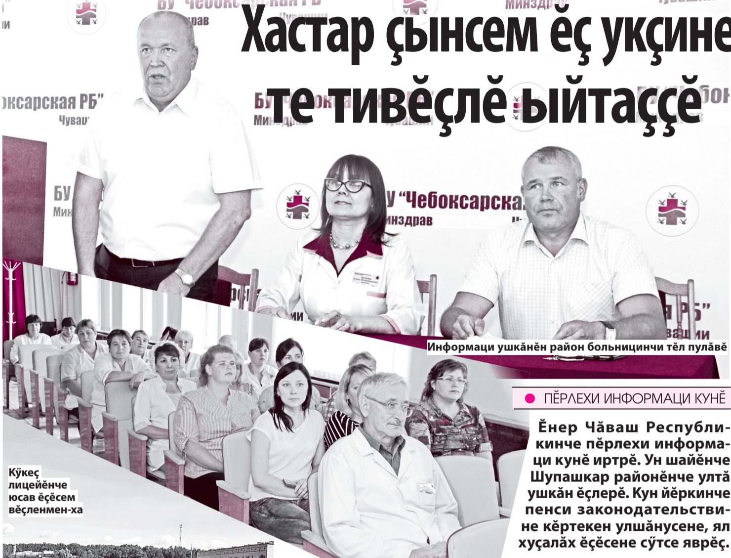
Информаци ушкăнĕн район больницинчи тĕл пулăвĕ