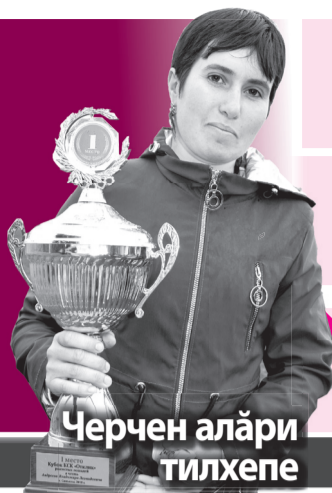
Черчен алари тилхепе