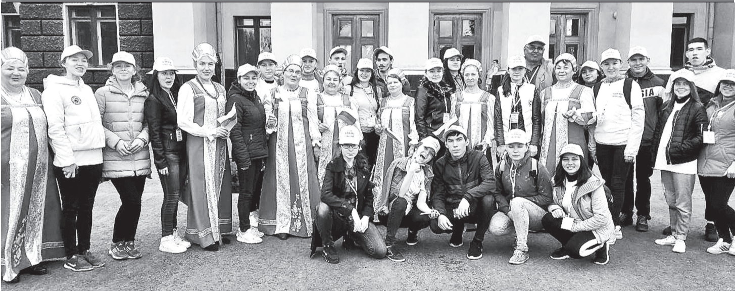
Сегодня вокальный ансамбль «Саванас» Пархикасинского дома культуры Синьял-Покровского сельского поселения принял активное участие во Всероссийской акции «Парад дружбы народов России», состоявшейся в столице Чувашии.