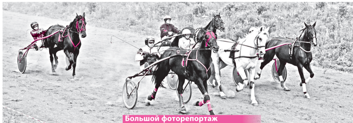
Большой фоторепортаж на www.tavanen.ru

орловские рысаки, и представители буденновской породы. Лошади конно-спортивного клуба «Отклик» участвуют в различных соревнованиях по всей России, фотоотчеты с которых публикуются в группе клуба в социальной сети «ВКонтакте».