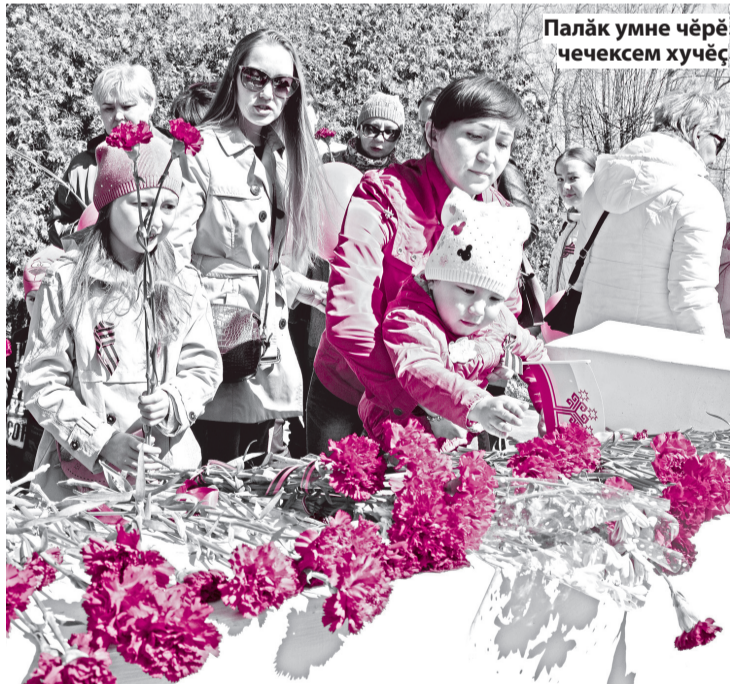
Палак умне чөрө чечексем хучөс