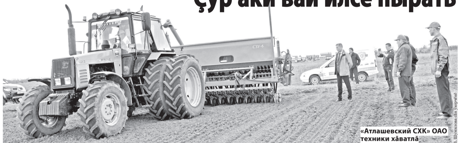
«Атлашевский СХК» ОАО техники хăватлă

ÇĒР ЛАПТАКĒСЕМ ТИП-СЕ ÇИТЕССЕ ЧĂТАМСĂРРĂН КĒТЕÇĒ УЙ-ХИРСЕНЕ. АГРОНОМЕМ УЙ-ХИРСЕНЕ ÇИНЕ-ÇИНЕМ ÇАВРĂНАÇÇĒ. ПĒЛТЕР «АТЛАШЕВСКИЙ СХК» ОАО ПУРИНЧЕН МАЛТАН АПРЕЛĒН 27-МĒШĒНЧЕ АКАНА ПУСĂННĂ ПУЛСАН, КĂÇАЛ ÇАНТАЛĂКА ПУЛА УЙ-ХИРЕ КАЯРАХ ТУХМА ЛЕKRĒ.