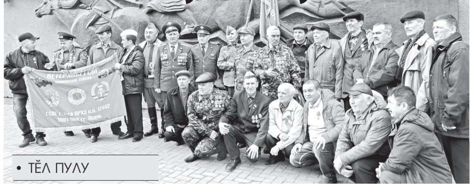
• ТӘЛ ПУЛУ

Совет Сәресән ушкәнәнче Германире хәсметре тәнә ветерансем майән 1-мәшәнче Шупашкарти В.И. Чапаев паләкә умәнче иртнә митинга хутшәнчә.