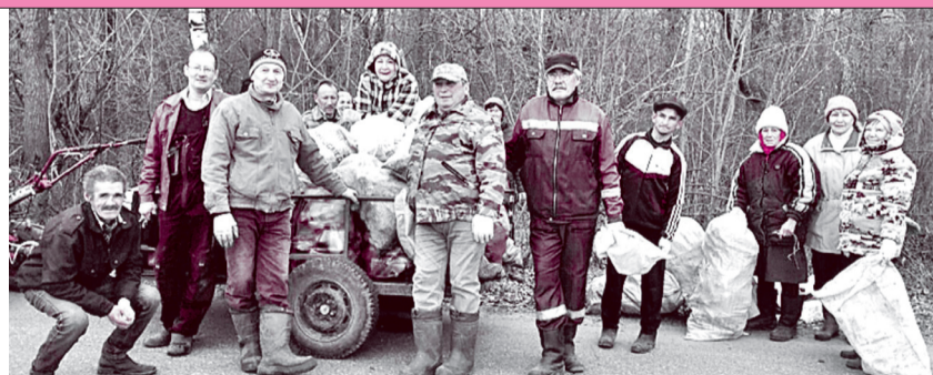
7 мая жители деревни Ердово Атлашевского сельского поселения посадили сосны на территории детского парка.