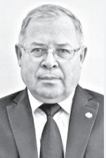
Александр ИВАНОВ , министр информационной политики и массовых коммуникаций ЧР:

В числе 12 приоритетных направлений – демография, здравоохранение, образование, жилье и городская среда, экология, безопасные и качественные автомобильные дороги, производительность труда и поддержка занятости, наука, цифровая экономика, культура, малое и среднее предпринимательство и его поддержка, международная кооперация и экспорт.