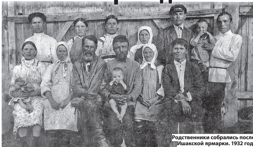
Родственники собрались после Ишакской ярмарки. 1932 год.