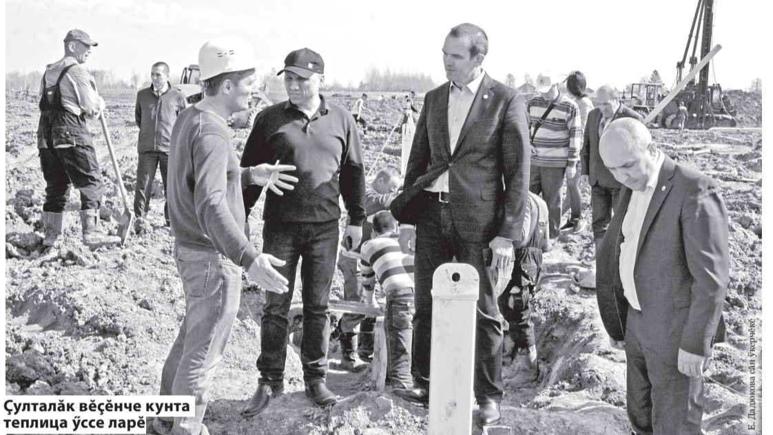
Сÿлталак вĕçенче кунта теплица уссе ларĕ