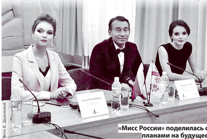
«Мисс России» поделилась с планами на будущее

Журналисты задавали много животрепещущих вопросов, фотогра-