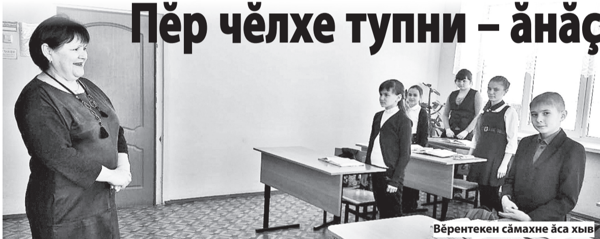
Вөрөнөкөн сәмахнө аса хыв

Шкул сывләшөпө сывласа пөтөмлетүсем турәмәр