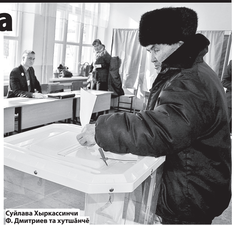
Суйлава Хыркассинчи Ф. Дмитриев та хутшăнчĕ

Янăш тата Ишек ял тăрăхĕсенче сасаланисен 80% Владимир Путин кандидатурине ырланă, ытти ял тăрăхĕнче – 71% пуласа (Кĕкес ял тăрăхĕ) 79% таран. Тĕпрен илсен муниципалитетра Владимир Путиншăн 26287 çын сасаланă (76,53%). Президент суйлавĕн сĕнтерĕшĕн сахал сас пани-