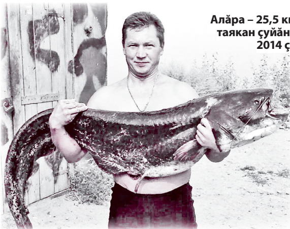
Алӑра – 25,5 кг таякан сўйӑн, 2014 җ.

– Темӑҗе җул каялла Мари Республикинчи Микряково ялѐ сўмѐнче Атӑл юкса ырткан ыраҗа сўпахсем тытма кайнӑччѐ. Виҗѐ юлташ, кашни хӑйѐн резина кимми җинче ларатпӑр. Якорьсем ятӑмӑр. Пѐр-пѐрне курмалла виҗкѐтеслѐх еврѐлѐ ларса тухрӑмӑр. Пѐр-пѐринпе калаҗатпӑр, савӑнтах пулӑ тытатпӑр. 1-2 кг таякан сўпахсене кимѐ җинчен донкӑпа тытатпӑр. Атӑл шывѐнче чирлѐ, солитерлѐ (вӑрам шурӑ шѐвѐрѐлченлѐ) пулӑсем ишсе сўрѐҗҗѐ. Акӑ ман кимѐ патне килограмм сурӑ таякан солитерлѐ пулӑ ишсе килчѐ. Эпир вѐсене чирлѐ пулӑнине тытмастпӑр. «Тытатӑп та юлташ кимми җине кулмалла ывӑтса паратӑп тесе» шухӑшларӑм, ӑскӑча (подсачек) тӑсрӑм. Пулӑ ман паталла ишме пуҗларѐ. 2-3 метр кӑна юлчѐ, ӑна ӑсса илес тенѐччѐ кӑна, җак вӑхӑтра хам пысӑкаш сўйӑн шывран айӑккан сиксе тухса җав пулӑа хыпса анса кайрѐ. Шыв сассине илтсе кимѐ җинче ларакан пулӑҗҗем шартӑх! тӑчѐс. Эпѐ шыва җӑмнӑ тесе шухӑшланӑ вѐсем. Ӑвӑса сур метр маларах тӑснӑ пулсан, сўйӑн пуҗсѐпе унта лекнѐ пулсан, мана кимѐ җинчен туртса ўкеретчѐ. җапла шўт тӑвасси пулмарѐ.