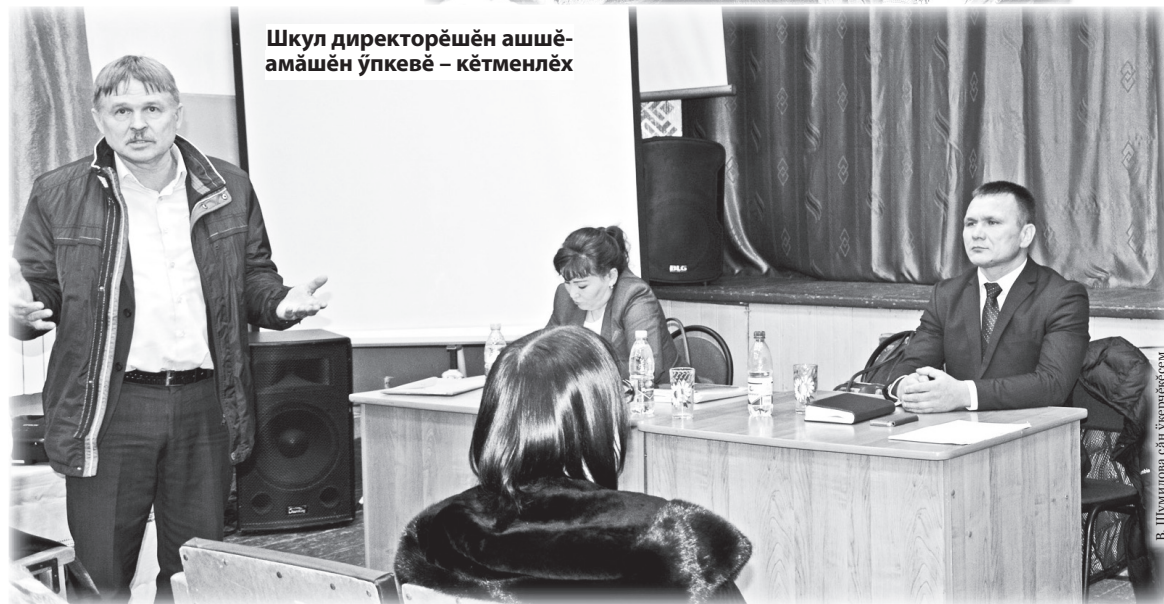
Шкул директорĕшĕн ашшĕ-амăшĕн ўпкĕвĕ – кĕтменлĕх

медсестра – яланах хапăл пулнине пытармарĕ. Сĕнъялсем патне вара эрнере пĕрре районтан