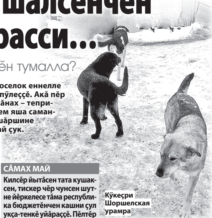
КӑкӑҶри Шоршелская урамра

Чуна Ҷӑсентерекен синкер нумаях пулмасть Мускав облаҶенче пулса иртнӐ. КаҶ кӑлӐм 19 султи качӑна пӑр теҶетке яхӑн йытӑ тапӑнни, унӑн пурнӑҶенчи юлашки минутсем урамри камерӑна та лекнӐ. Йытӑсем Ҷамрӑк арсынна пуҶӑнчен, алли-уринчен туллса пӑтернӐ. Качӑа виллине тепӑр кун ӑна тупнӑ. Янавара семкӑне тапӑннӑ ыраҶтан Ҷӑр тӑрӑх вӑтӑр метра яхӑн сӑтернӐ. Ҷакна шура юр Ҷинчи хӑп-хӑрлӑ юн йӑрӑсем тага йӑри-тавра йӑваланса ыртӑкан Ҷи-пуҶ татакӑсем сирӑплетессӐ. Йытӑсем Ҷаварӑнчен асапланса вилнӐ качӑн савнийӑ – Юрий Лоза музыкант таванӑ, Ҷамрӑк хӑрарӑман тепӑр уйӑхран ывал сураҶмалла. Ашшӑ тепренӑкне кураймасӑрах вилнӐ. Ҷак кунах, икӑ сехет