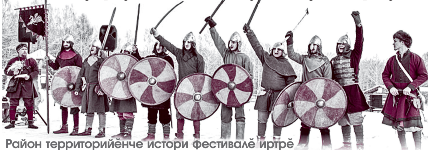
Район территориянче истори фестивалѐ иртрѐ