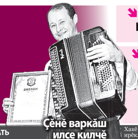
Сенә варкаш илсе килчә

«Пёчәк така» аварие сиенсёрлетрә КУН-ҖУЛ ШАҖСИ ■→ 4