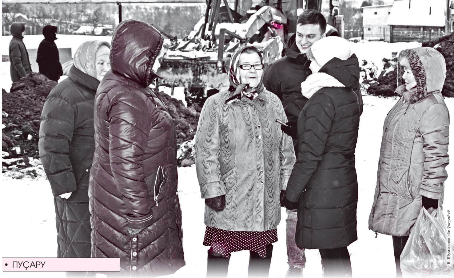
Чәркашсен саванәсә ситет