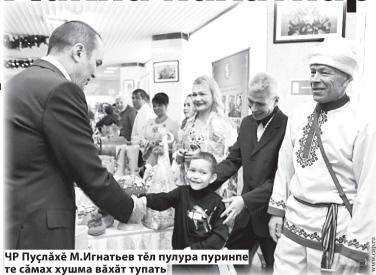
ЧР Пуслакё М.Игнатёв тёл пулашу пуринпө те саванаса хушма вахат тупать

«Год Матери и Отца» саванасем чавашла сакан пек илтёнесчө: «Аннепе Атте сулө». «Сул» саванаса вырасла кусарсан «путь»