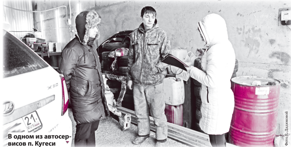
В одном из автосервисов п. Кугеси