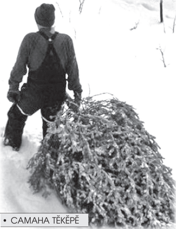
• САМАНА ТӐКӐРӐ

СӐнӐ сӑл умӐн вӐрмантан симӐс «чиперкесене» касса каякансен йышӐ палӐрмалла ўсет. ВӐтлӐхре пуртӐ сасси кӐларакансене тупса палӐртас тесе вӐрман хуралсисем хыр-чӐрӐш ўсекен вырӐнсене полици ёсченӐсем пӐрле кашни кун пӐхса саврӐнассӐ. ВӐрман фончӐн сӐрӐсем сӑнче лӐсӐллӐ йывӐссене саккунсӐр касакансене асӐрхаттарас тесе декабрь уйӐхӐнче сӐршыври пур субъектра та «ЧӐрӐш» операци пырӐты.