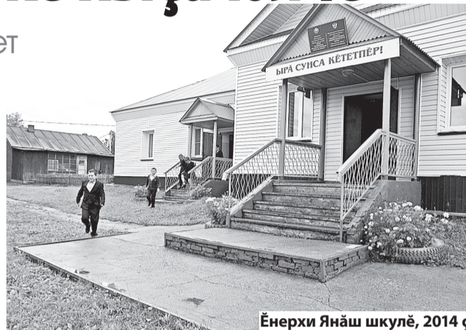
Ёнерхи Янăш шкулĕ, 2014 ç