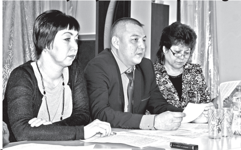
Ёçлев ушкăнĕ. Атайкасси ял тăрăхĕнче