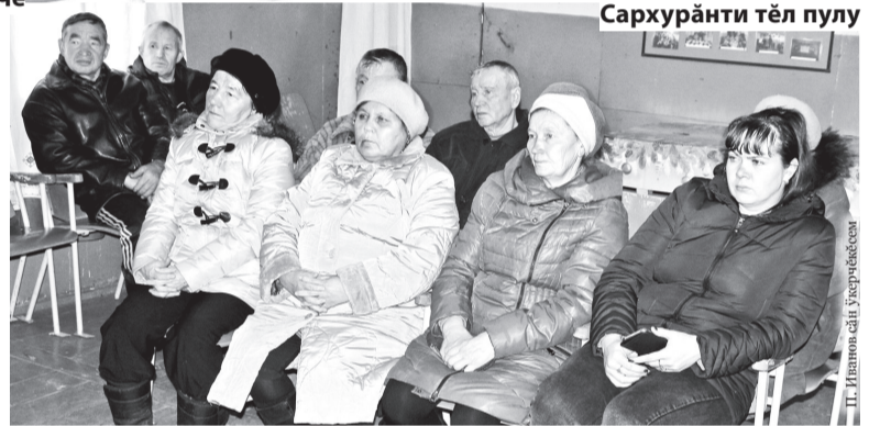
Сархурăнти тĕл пулу

Çакан хыçсăн информаци ушкăнĕ Сĕнĕ Тутаркасси поселокĕнчи пултарулăх сÿртĕнче вырăнти сÿнсемпе тата «Атлашевский» СХК» ООО ёç коллективĕпе тĕл пулчĕ. Медицина учрежденийĕсене централизиленĕ тытăма куçарнипе медицина анализĕсене Кÿкеçре тĕрĕслĕçĕ, çакă диагноза хăвăрт палăртассине чарса тăратать. Кунсăр пуçне Тутаркассинчи участокри больницара кадрсен ситменлĕхĕ те сисĕнет. Çынсем