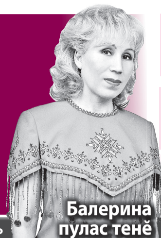
Балерина пулас тенё