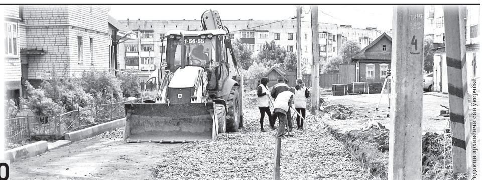
Результат мероприятий с 16 ноября