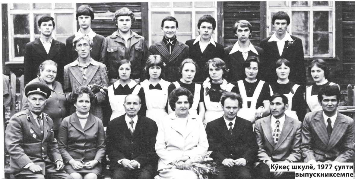
Кўкеç шкулĕ, 1977 сұлти выпускниксемпе