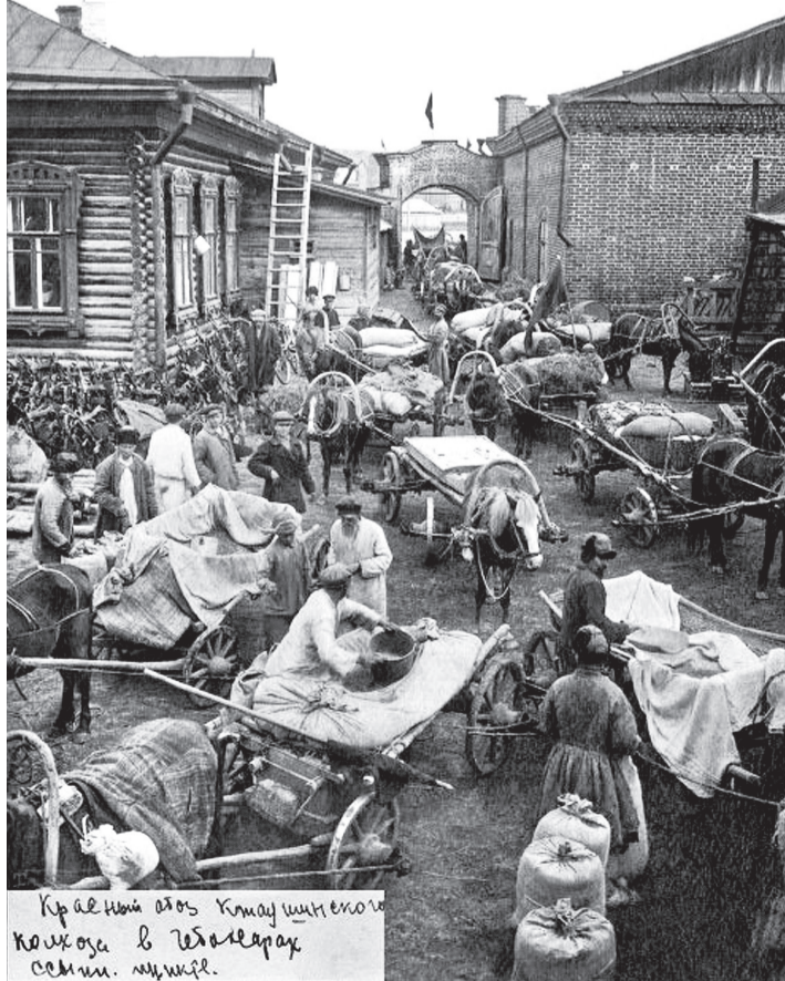
Красный обоз Кжаушинского колхоза в Чебоксарах. 1929 г.

Красный обоз Кжаушинского (Кшаушского) колхоза Чебоксарского района. В Чебоксарах прибывшие Красные обозы, после проведенных митингов, направлялись на ссыпной пункт, который находился во дворе домов №13 и №15 по Речному переулку. На фотографии братьев Костиных мы видим прибытие Красного обоза Кжаушинского колхоза (Чебоксарский район) с зерном именно на этот пункт. Слева, возле дома №15 стоят плуги, возможно для обмена, а арочные ворота выходят на Речной переулок и детский парк имени Н. Крупской. 1929 г.