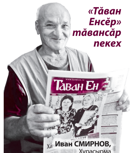
«Таван Енсөр» тәвансәр пөкөх