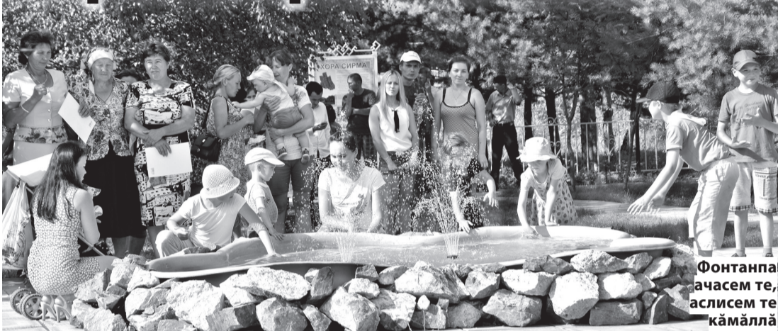
Фонтанпа ачасем те, аслисем те камалла

Янэш ялёнче культурапа кану паркё усёлчё