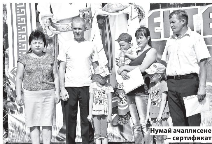
Нумай ачаллисене – сертификат

илмелли самаых. «17 султа 9 класс пётерсен сурах фермине кайса кётём. Анне чирлесе үкнёрен 10-мөш класра 25 кун канэ вёрентём, кайран фермара ёсленё вэхатра кашхи шула пётертём. Учительсем пире фермана килсех пёлү паратчёс», – аса илү сэмхине сүтет пенсия сүлёнчи кинемей. «Прогресс» хушалэх цига йатрла сурахсене ёрчётнэ ун чухне, хёрарамсем ас тавасса, 360 паранламалли сурах, сёршер такапа путек үстернё. «Сурахсене куравсене илсе тухас умён шампуныпе суса тасаттамар», – самах хушассё иртнё сулсене аса илсе юнашар таракансем. Алёпа сэм каснине те, сак ёсепе бригада