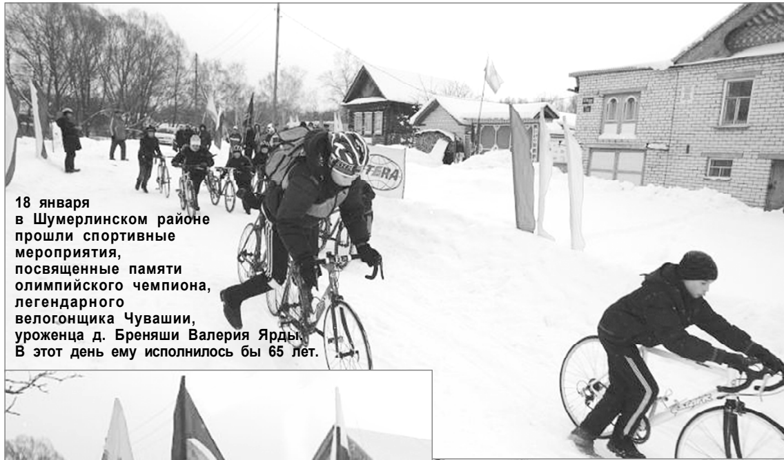
18 января в Шумерлинском районе прошли спортивные мероприятия, посвященные памяти олимпийского чемпиона, легендарного велогонщика Чувашии, уроженца д. Бреняши Валерия Ярды. В этот день ему исполнилось бы 65 лет.

Чемпион мира 1970 года, участник XIX Олимпийских игр (1968 г.) и чемпион XX Олимпийских игр в Мюнхене (1972 г.). Заслуженный мастер спорта СССР. К сожалению, ярко вспыхнувшие звезды гаснут быстро. Так и Валерий Ярды ушел из жизни на 44-м году жизни. Но в народной памяти он навсегда остался таким же молодым, простым, мужественным, трудолюбивым и самоотверженным Человеком с большой буквы, патриотом своей Родины, каким он был при жизни.