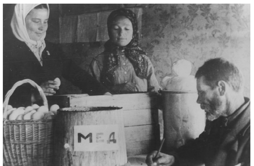
Колхозники сельхозартеля Чувашской АССР - за упаковкой подарков для защитников Сталинграда. 1942 год.

лось, что "... На 5 января 1943 г. в Госбанк поступило дополнительно 11000000 руб., а всего на это число поступило 42510000 руб., в том числе на строительство танковой колонны "Колхозник Чувашии" - 40634000 руб., "Тракторист Чувашии" - 1876000 руб. По инициативе комсомольцев широко развернулся сбор средств среди молодежи на строительство эскадрильи боевых самолетов "Комсомолец Чувашии", среди медицинских работников собрано на строительство танковой колонны "Медработник Чувашии" 10000000 руб. Воодушевленные общим патриотическим подъемом масс, в сбор средств на строительство танковых колонн и боевых самолетов включились учителя, служители советских учреждений, торговые работники, коллективы промартелей и другие. ... На строительство танковой колонны "Колхозник Чувашии" более организованно проводился сбор средств в районах Порецком - 3086000 руб., Алатырском - 2726000 руб., Чебоксарском - 2217000 руб., Вурнарском - 2057000 руб., Мариинско-Посадском - 1674000 руб., Калининском - 1683000 руб. Среди коллективов МТС лучшие примеры в сборе средств показали Яльчикская МТС, собравшая 152000 руб., инициатор по сбору средств на строительство танковой колонны "Тракторист Чувашии", Чебоксарская - 148000 руб., Ку-