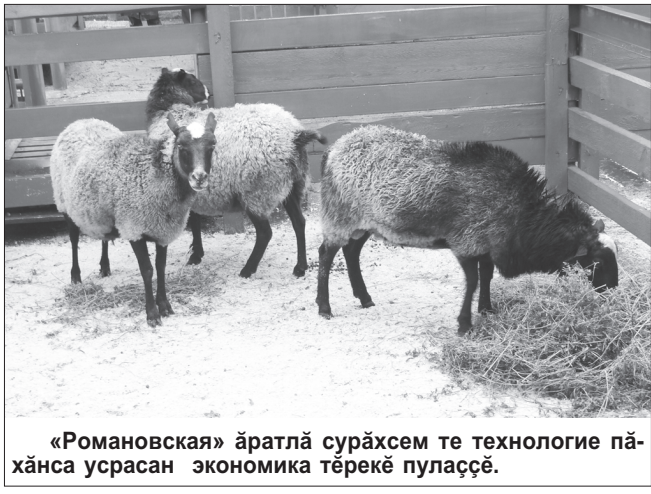
«Романовская» а́ратла́ сура́хсем те технологи́е па́хна́са усрасан экономика́ тёрекё пула́счёс.