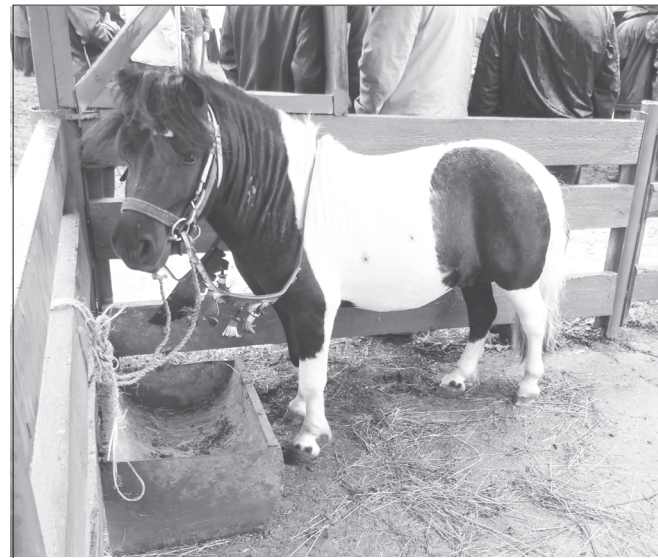
Вай хурсан килте те пони ўстерме пулатъ.

пу́лемсенче-картасенче вы́ран йы́шáнна а́ратла́ ёнесем, тына́шкасем, лашасем, понисем, курса сурёкенсене ку́сран па́хакан сура́хсемпе кача́ксем, пыл хурчёсем, чáкпа авансем, путенесем, хурсемпе кáвакалсем, фазансем (сунара сурёмеллисем, Румыни а́ратлисем, кёмёл тата ылтáн тёслисем), цесаркáсем, кáрккасем, бассей́нра ишекен тёрлэ тёслэ пулáсем... Кашнин патёнчех а́ратла́ха áнлантарса тата выль-