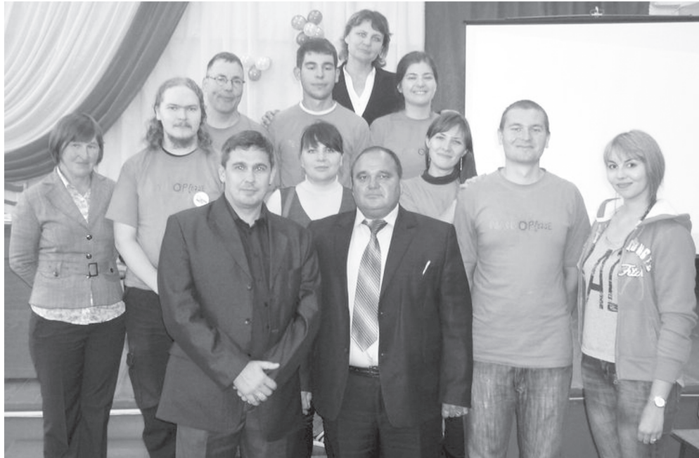
Хаçатра сьрнă хыççăн