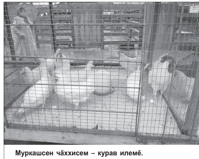
Муркашсен чáххисем – курав илемё.

Выставка пётёмлетёвё Муркашсен мал турта́мла́ пурáнма, а́ратла́ выльáхпа тухáслá ёслесе экономика́ра сёне ўсёмсем тума вы́рантах май пуррине кáтартрё. Сáк выставкáра Муркашсен а́ратла́ выльáхсеме нумай хисепе тивёсрёс: «Моргаушская» чáх-чёп фабрикинчен илсе пына́ сáмарта́ тумалли «Хайсекс белый» а́ратáри чáхсем 1-мёш степеньлэ аттестата, «Фаворит» чикёллэ яваплáхлá общество́ри «Медео» тата «Фаворит» кáвакалсем 1-мёш степеньлэ, «Кучинская» а́ратла́ чáхсем 3-мёш степеньлэ аттестатсене