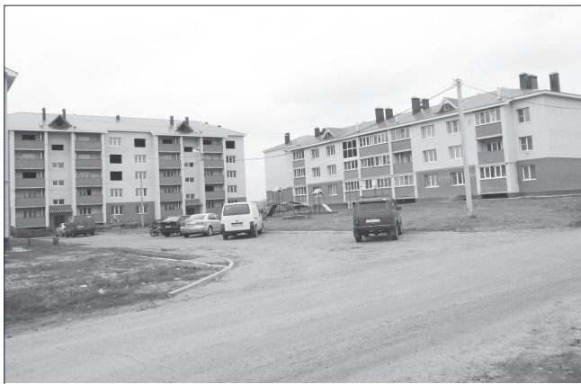
Муркашра сөклөннө пилөк хула нумай хваттерлө пуранмалли сурт – "Моргаушская" строительство организациён черөтлө аталану утамө.

– Пурнас аталанавөпө тан пырса эфир район центрёнчө пилөк хула нумай хваттерлө пуранмалли суртөм тавассине алла илтөмөр. Хваттерсенчө сынсене камалла та хәтлө пултөр тесе хваттерсен сөнө каләпәшөпө ёслөме пусларамар. Ку вёл сынсен пурнас условийөсөне тата райцентр сәнне тёрөн улаштарма пулашть. Саканпа перлөх пирён организаци асла әрурисене пулашма та яланах хатёр. Эсир хавар сүлсөм иртинпө пусарсене ан усар. Турра ёненнипе, вёл пулашнипе сирён пурнас сүләрөсөм татах вайрам