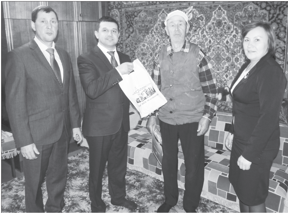
"Моргаушская" МСОра телейме тупрам", – йал кулă парнелерэ 87 сұлхи М. Хошкин асанна предприятин паянхи ертүсинчен В. Семеновран уяв парни илне май.

Пурнасан кирек-хаш тап-хэрэн илемне те курма-туйма пултаракана чаннипех телейлэ теосем килет манан. Пирен хушамарта вара малашлахпа пурнакан саван лексынсем перре мар тел пуларсе. Вёсем хайсен пурнаселле, пултарулла ёсёхелёпө паянхи самраксемшен ыра тёлсёлх пулса тарассе, ытисене те пурнас илемне курма тата унга туллин килемне вёрентессе.