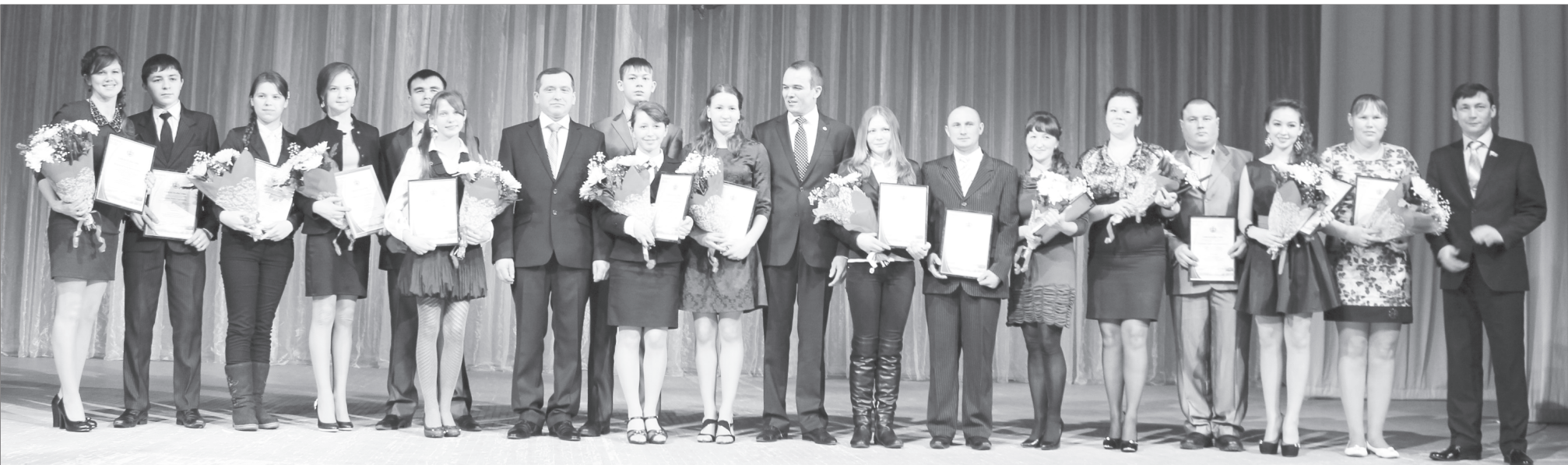
Чăваш Республикин Пуслăхён стипендиачёсем – хастар сарăксем. Вёсен аллинче – тăван ен пулслăхэ.