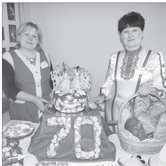
Лантәш пекарнинче район 70 сұл тултарнине халалласа ятарлә сәкәр пёсерни эфир сәкәр-тәвара мала хуни пирки калать.

Сак кун Муркашсем сине Хисеп грамотисемпе Тав сыравёсен «сумәр» сурө те