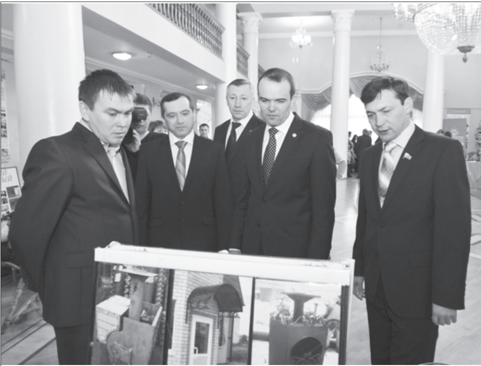
Чăваш Республикин Пуслăхэ Михаил Игнатъев район экономикин выстакипе, социаллă пурнăç аталанăвепе тёллен паллашрэ, районан малашлăхэ пуррине палăртрэ.

Районăмър кунэ ячепе ирттернэ саванăслă лару кăшал нарăс уйăхен 14-мешенче К. Иванов ячепе хисепленекен Чăваш академи драма театрэнче иртрэ. Палăртнă вăхăта пур ёс коллективесен делегацие те уяв залне пуханса ситрэ. Халăх йышлă суремелли вырăнсенче районти культурăпа архив ёсесен пайэ йёркеленэ куравсем, культура ёсченёсен юри-кёвви, Муркашпа Мән Сентёр райповёсем пусарнă суту-илу тата кунти техёмлэ кукаль шăрши уяв чапне ўстерчёс кăна.