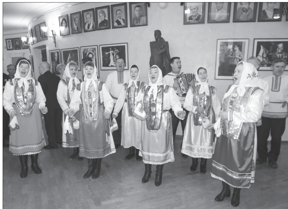
Ханасене Муркашсем ташă-юрăпа кётсе илещё.

хатларах пултър, унан экономика социаллă аталанăвё сёнэ хăвартлăхпа малалла кайтър тесе тимлесси – пирён умри пёрлехи тёллев. Рассей Президентё В. Путин вырăнти хай тытамлăха аталантарассине патшалăхан тёл задачисенчен пёри тесе палăртрэ.