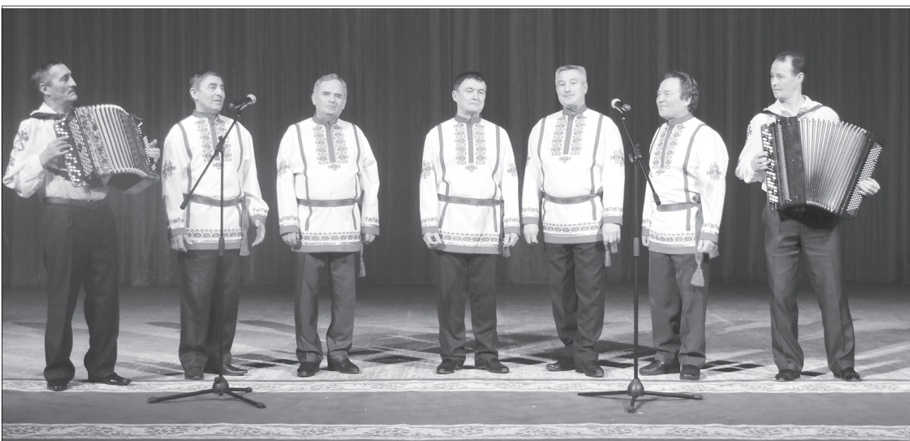
Сцена синче арсынсен ушкәнө илемлө юрә шәрантарать.

Районта пурәнмалли сурт-йөр, социаллә сфера объекчөсем, сұлсем тавасси пысак масштабпа пырать. Иртнө сұл инвестици ёсхөлле аталантарма төрлө сәл куфри укса-тенкөне 1,5 миллиард тенкөне яхән явәс тарнә. Ку вәл 5 сұл каяллахинчен 8,4 хут нумайрах. Сак сұлпа кайса асанна тапхәрта нумай хваттерлө 6 сурт хута яма май килчө. Кунта «Моргаушская» МСО пирки ыра