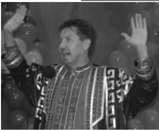
ТВОИ ЛЮДИ, РАЙОН