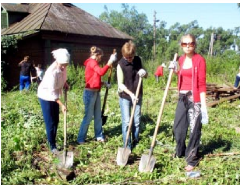
НА СНИМКЕ: молодые работники учреждений организованно вышли на экологический субботник.

Глава района А. И. ПЕТРОВ. п. Ибреси, 17 июля 2007 г., №406.