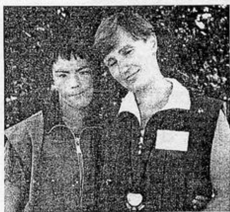
Амăшĕ вырăнĕче – воспитатель.

Нумай чухне сывă-тĕреклĕ, сителĕклĕ пурăнакан ҫынсемех шăпа ҫине ўпкелешнине илтме пулат. Анчах та теҗрисен инкекĕпе танлаштарсан вĕсен «найкăшавĕ» ним тĕшне те тăмасть