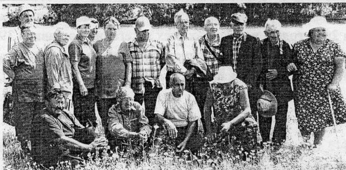
Сӑн ҫӗркӗче сҫлла инвалидсем хушшинче ирттернӗ пулаҫ кунӗнче тунӑ.

района: Общество слепых, Общество инвалидов – которые проявляют внимание и милосердие к людям с ограниченными возможностями и помога-