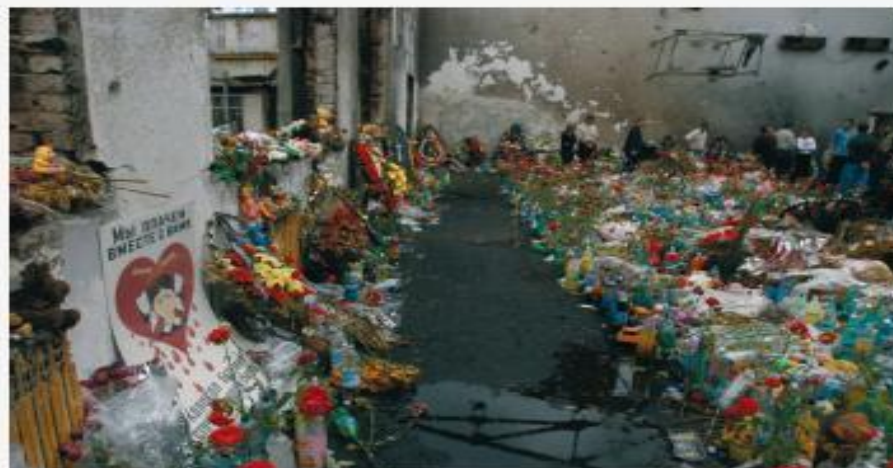
Беслан, сентябрь 2004 г.