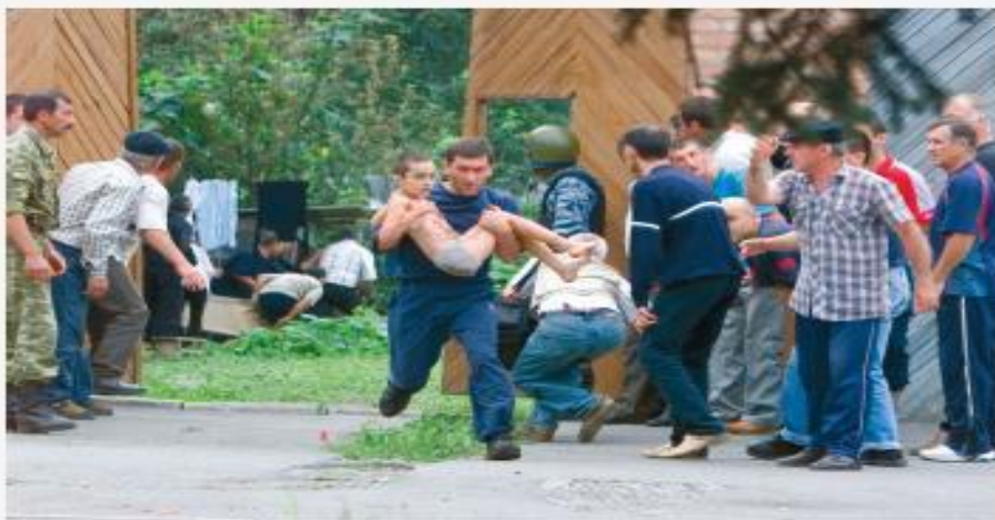
Беслан, сентябрь 2004 г.

Никто, к сожалению, не защищен от ситуации, когда может оказаться в заложниках у террористов