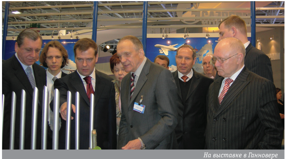
На выставке в Ганновере

- Путь в будущее возможен только в постоянном развитии, и мы рассчитываем идти очень быстро - разрабатывать и производить собственное уникальное оборудование, не только соответствующее