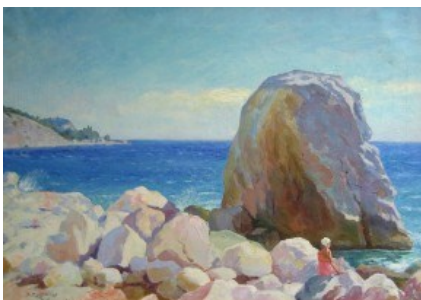
М.С. Спиридонов. Крым. Пейзаж со скалой. 1935 г.

рождающейся в то время чувашской живописи.