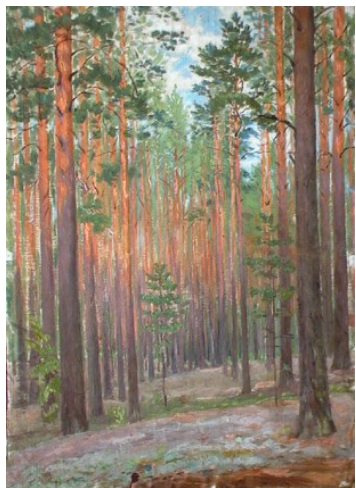
М.С. Спиридонов. Сосновый лес. 20 в.

За большие заслуги в области изобразительного искусства в 1970 г. занесен в Почетную Книгу Трудовой