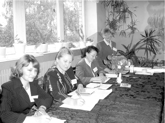
Республика Патшалӑх Канашӗн депутатӗсен суйлавне ҫатракасси суйлав участокӗнчи суйлавӗсем те активлӑ хутшӑнчӗ. Сӑн ӱкерчӗкӗ: суйлав участокӗн членӗсем ӗҫре.

Октябрӗн 8-мӗшӗнче Чӑваш Республикин Патшалӑх Канашӗн депутатӗсен суйлавӗ иртрӗ