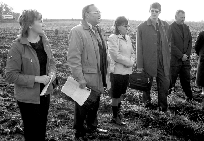
Министерство кунне ирттерекенсем ыйтусем җине тулли хуравсем пачёҗ.