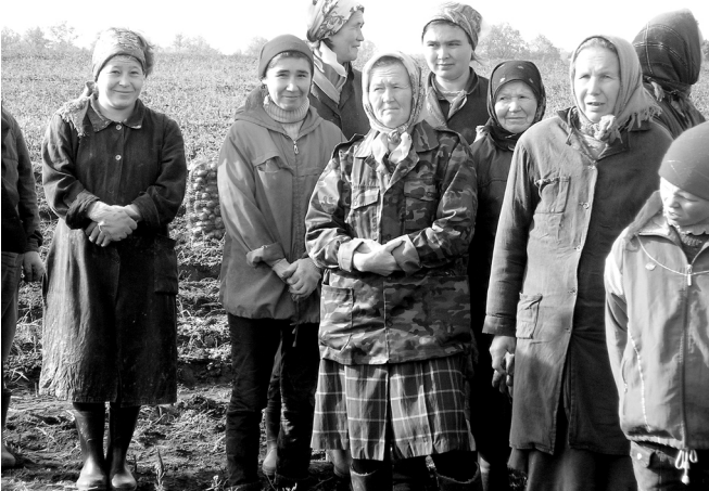
Пурнаҗсра тан пырас тесен кашнийөнөх ыйтусем пур.

– Хәшпёр ашшө-амәшө-сем укҗа-тенкөллөх пул-манран тата хәшөсем эрех-сәрапа тусләран ай-әпсәр ачисем шулта кан-тәрлахи вёри апата та укҗа парса сийёмнен сақанта дотациллә апатланәва ёҗө кёртме май сүк-ши? (Нис-касси). – Шыв проблеми вуншар сүл пыратъ. Мён тумалла?