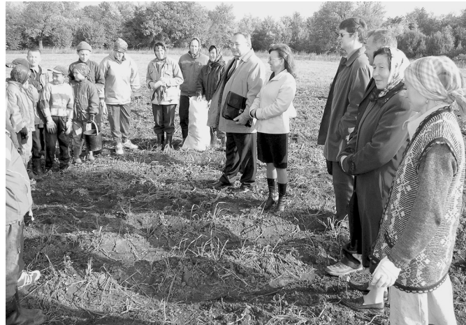
Министерство ёҗсенёсемпе тёл пулава кашни сёртех халәх йышлә пухәнчө.