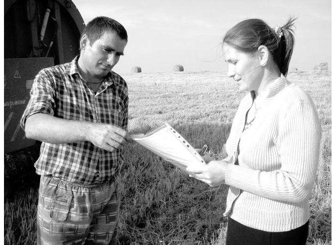
Г. Илларионов улам преслас нормёрна епле пурнаё-ласа пынипе В. Никифорова экономист паллашать.