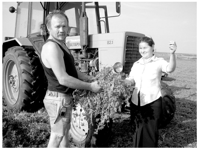
Н. Болеславпа В. Егорован каю утти паха апат пу-ласси пирки иккёлөнёр сук. Сулмалли вара чылай-ха...

сынран тэрэкан бригада кунё-пех хиртен килнё тырёрна алать, типётет, склада кёртет. Кунти ёсёсене А. Игнатёвна А. Арте-мёв машинистсем йёркелесе пырасёсё. Паян урама аван уйахё. Кун тэршшёр 13 сехет те 46 минут. Эрне вёсене вёл татах сур се-