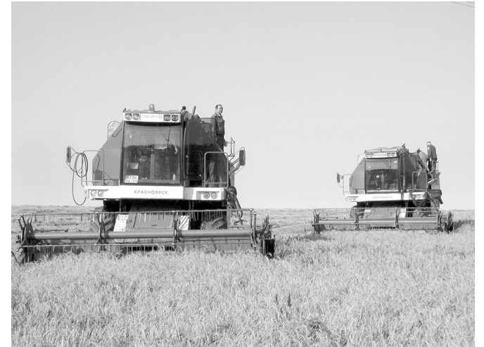
"Свобода" хуçалăхра кăçалхи вырмана сĕнĕ комбайнсенчен виçĕ "Енисей" тата икĕ "ДОН" хутшăнаççĕ.