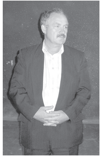
ячѣпе иртрѣнѣ сѣк пѣчѣк пухурах Муркаши кирлѣч завочѣн малашлѣхѣ пурри, а́на кунта ѣслекенсем шанса тѣни тата сѣнѣ ѣс мелѣсене пурнѣса кѣртсѣх пыни куранчѣ.

пѣ, хѣтлѣ магазинсем пурнѣса кѣртѣссипе тата вѣсене юсаса тарѣссипе палѣрнѣ строительством тѣрлѣ шайри Хисеп грамотисене тивѣсрѣс (сҗлти сѣн ўкерчѣкрѣ). Тѣрѣс калать район пуҗлахѣ: ѣслекѣнѣн ѣсѣ те пур, чыс-хисепѣ те сҗмрах.