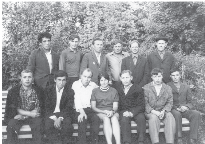
"Свобода" хушалахә водителө-механизаторөсем Ильинкәри кану сүртөнчө (1973 сұлхи июль. В. Авилов хысәлти рөтрө сулахайран иккөмөшө).

на хушалахә сүнчөн патшалак маннә текен вахәт хыса юлчә: паян сәр өсәненчә, выльах-чёрлөх пахнә сәрте өслөкен кашни сүн - хай сине патшалак тимлөх уйәрнәран - пәлтерешлө өс вайө пулса тәрәт. Вөсене пирән кашине сума сумалла, туллин чысламалла. Сак султан пәрәнас мар тесе паян өлө те хам сәмаха калас терәм.