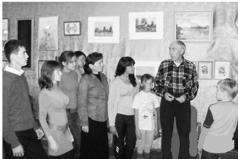
Чуманкассинчи информация культура центрә сумәнчи Анаткас Апаш ял клубәнче курав еҗлет. Унта Раҗсей Федерацийән вәрентү еҗсән хисеплә еҗсәнчән Н. Юткинән үкерчәкәсемпе паллашма май пур.