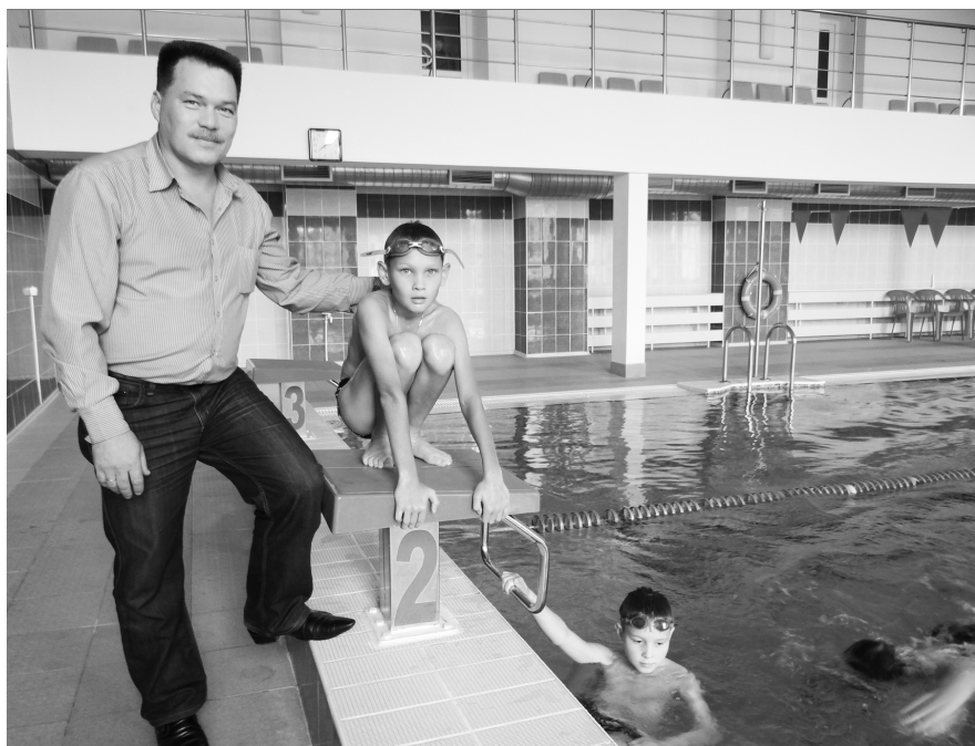
Районти пĕртен-пĕр бассейн нихăсан та пушă мар.