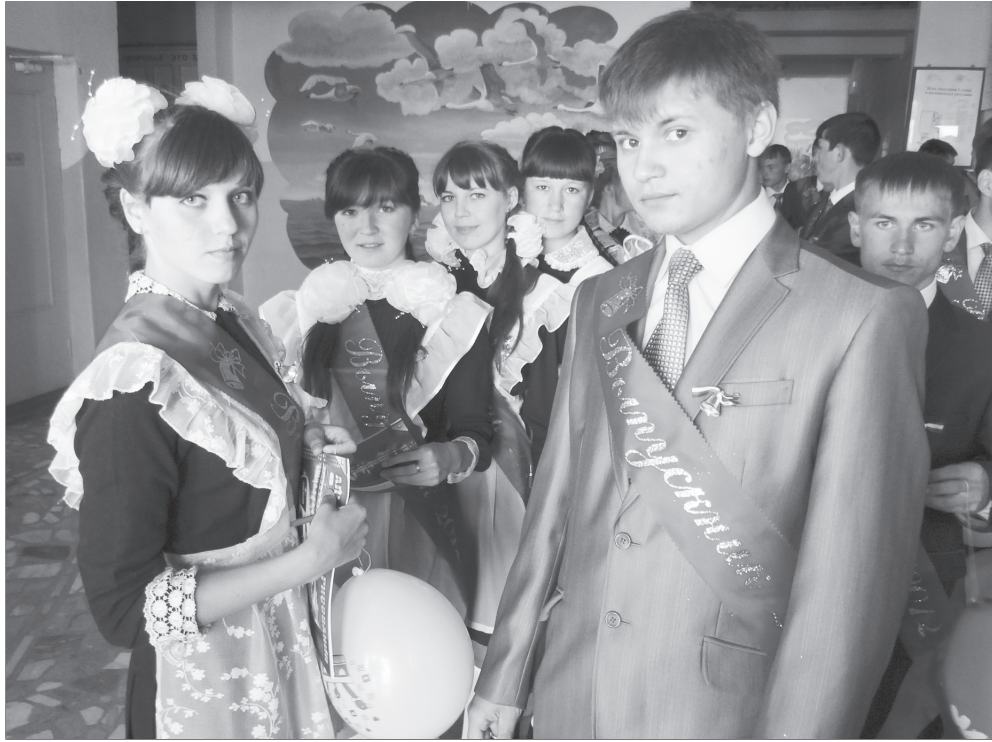
Районти шкулсенче ёнер 11-мёш классенчен вёренсе тухакан 252, 9-мёш классенчен вёренсе тухакан 375 яшпа хёршён юлашки шанкарав янарарё.