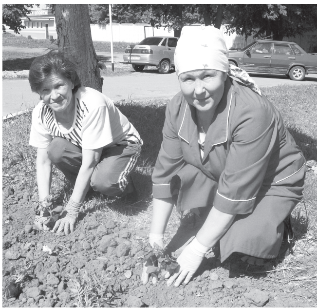
Тирпей-илем – хамәршән

көнине пытармасть. «Чечексем лартнә хыҗсан хәт көрет», – терө пөрлехи дежурнәй-диспетчер