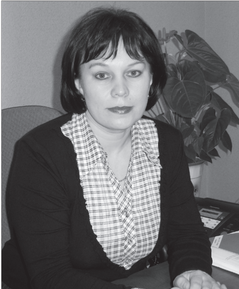
(Вёсэ. Пусл. 1-меш стр.)

Пёрре пәхма ун пекех нимёнпе те паларса тәман хушма офис усәлнине мён пирки ун пекех чыс-ха? Мёншён тесен «Россельхозбанкшан» ял вәл – тәп приоритет, тәп пәлтереш. Ҷакна асанни те ытлашши мар. Банка 2000 Ҷулта РаҶсей Президентчён Владимир Владимирович Путинан хушәвәпе йёркеленә. Ку вәл Ҷёр проценчәпех патшаләх капиталәпе йёркеленнә организаци, Ҷавна май агропромышленно комплексне аталантарассишён ответләха та самай хәй Ҷине илет. Тёрәссипе «Россельхозбанкн» республикан районсәмпе хулисәнчи офисәсене ним Ҷук Ҷёрте йёркелеме тивнә. Хәлә вара «Россельхозбанк» РаҶсейри чи пысәк 4 банк шутне кәрет, шанчәкләх енәпе рейтингра малти 3 банк хушшинчә.