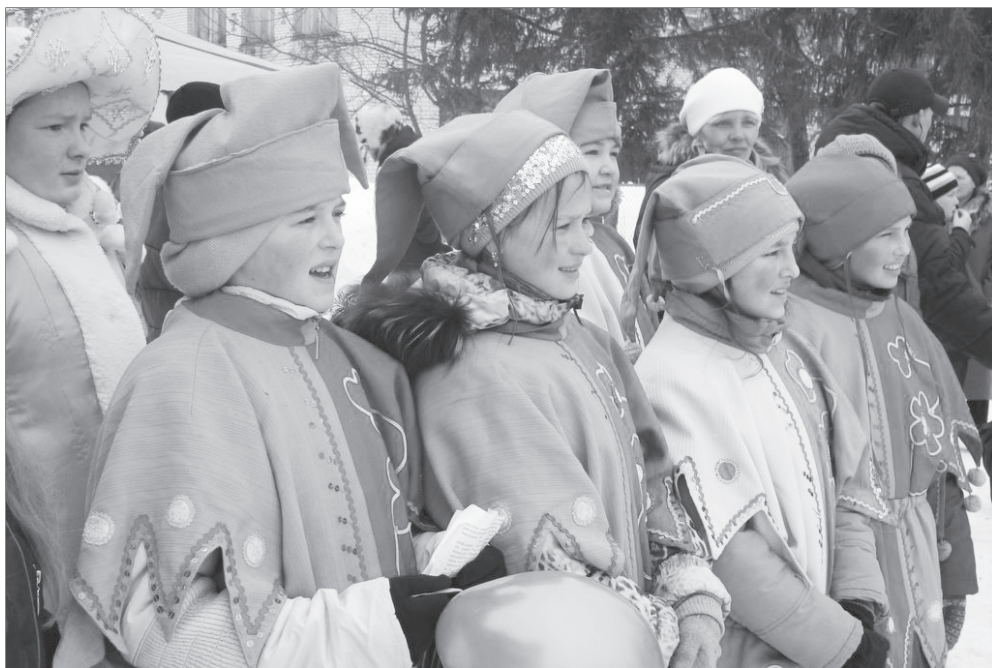
(Вёсә. Пусл. 1-меш стр.)