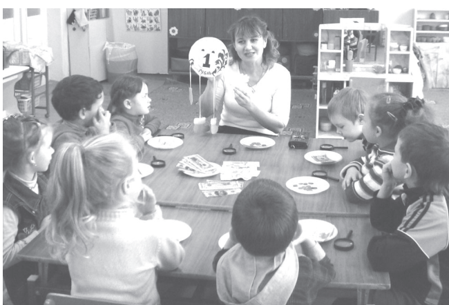
пирөншөн, воспитательсөмшөн, чи пөлтерөшли.