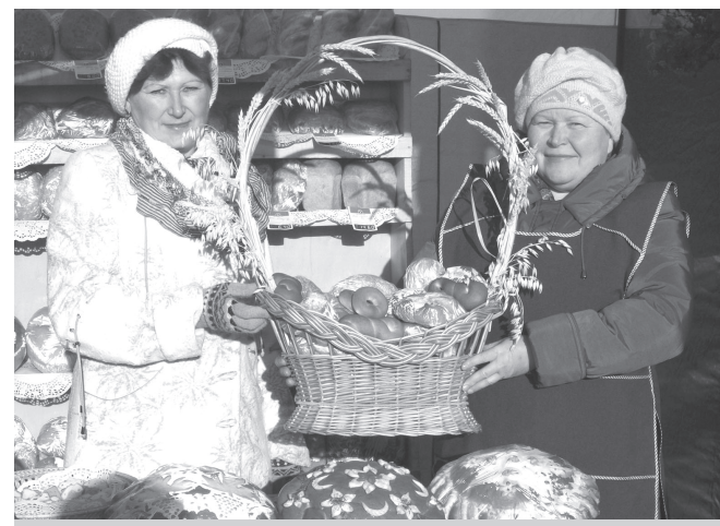
Килӑр, туянӑр, хӑналанӑр!