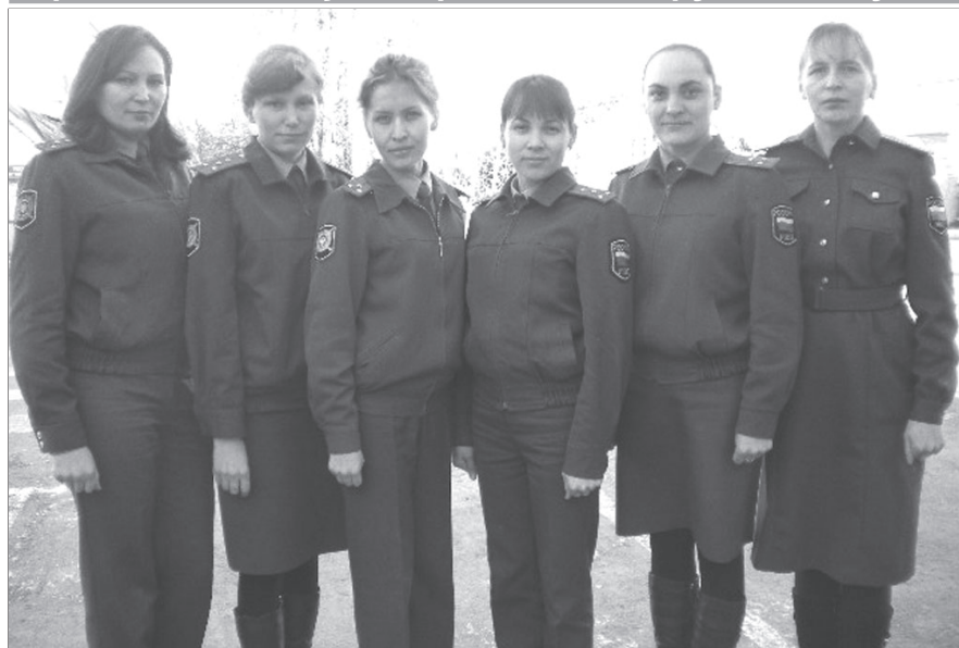
(Вёсё. Пусл. 1-мёш стр.)

Ыран – Шалти ёссен органёсен сотрудникён кунё