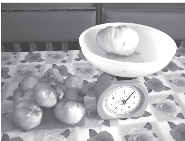
Пёр помидорё – сур килограмм ытла!