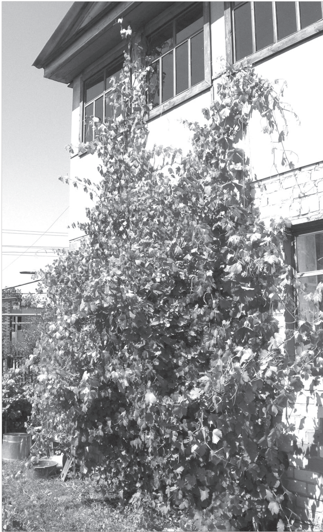
Җүлтен җүле улахать виноград.