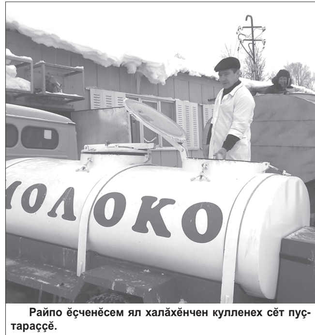
Райпо ёсченәсем ял халәхәнчен кулленех сәт пуҫтарәсә.

Пирән икә пекарня халәх сәкар-булка издәлийәсемпе тивәстерет, вәсем те пысак тупәшлә ёсләсә.