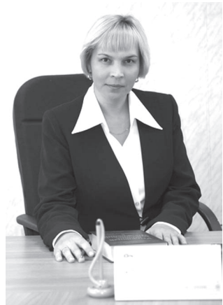
Паянхи пурнәсра саккун малти вьрәнә тухни яр усчән курәнәт. Пусләхө рядовой ёсчен – саккун умөнчө пурте пёр тан.