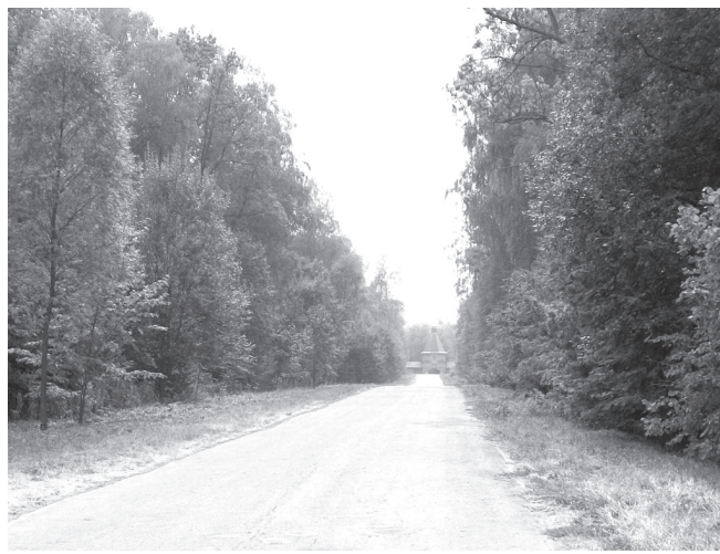
Сак тикөс сүл Таса вярәнә илсө ситөрет.

оншар ура пусса иртнө сукмакөсемпе пыратән та сү кунөсенчө те сүлсәсөн сәрәләхө витөр хөвел шөвли сөр питне аран ситнө вярәнсене ситсен юман сүлсисөн пәшәлта-тәвөпө сана хайне евөр асамләх, вәрттәнләх хуп-ласа илет. Самантрах ис-тори инсөшне каятән, ха-мәр таврарах сакнашкәл пуян вярән пурришөн са-вәнатән. «Ей Сүлти Ат-темер! Санә яту хисөпе-лентөр...», – савәннипе сисмесөрөх пәшәлтатать тута. Рус сөр-шывөнчи пур