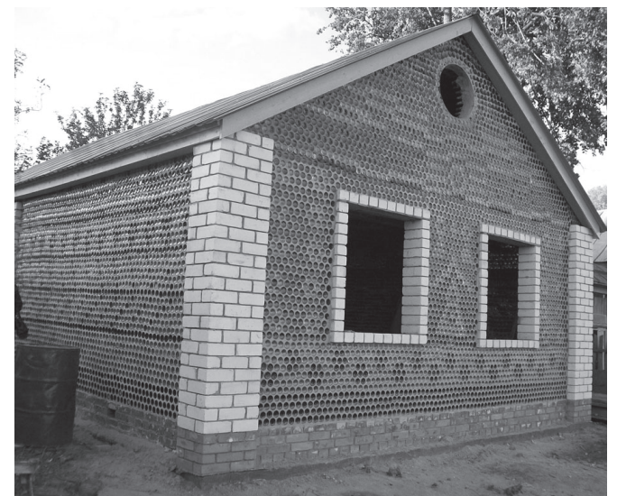
Сакнашк телёнтөрмёше тел пултёмар эфир Шетмёпус ял тархёнчи Опрыскьялте. Унченрех пушта тухакан хапат-журналсенче в телевизорпа сёс кураттёмар пулсан, сурт-йёр тавас сёне технологи пирён патёмара та ситрё. Иртнё су күнёсенче ана ёстална В. Павлов фермер төрлө теллө кёленчесеме уса курса сурта тул енчен те шлемлетнө. Кил хуш эфир пулна чух килте пулманран кун чухлө пуш кёленчене мён вэхат пуштарнине пёлеймерёмёр. Шутласан, кашни ялтах тата пур сүлсем хёррипе те пуш эрех-сара кёленчисем ытлашшипех йаваланса вьртасёсё.