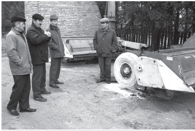
Комисси кашни техникана управа лартнине тереслет.