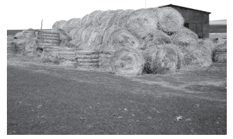
Фермáсенче ута́-ула́м сителэ́клипех. Ку савáнтарáть.

Юсав ё́сэсене туллин пурна́сланá пулсан та, Вáрманкасси уйра́мёнчи сёт ферминче кулленхи юсав ё́сэсем пирки те манма́сшэ. Са́пла вара сы́ва́х ва́хатрах ёне сарайёнчи йывáс урайсене тёллен-тёллен юсаса сёнет-