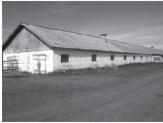
(Вёсэ. Пусл. 1-мёш стр.)

Чкалов яч. хис. хушала́хра паянхи куна майракалла́ шултра вилья́хсем 163 пул. Вёсенчен 53-шэ сумалли ёнесем. Шáпах вёсене йышлатасшáн та ёнтэ хушала́х ертýси. Самра́к вилья́хсене тара́нтарна́ сёрте Исетеркё́сем экструди́рованна́й апатпа уса́ кура́сшэ. Техно-